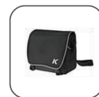
Sacoche « K »