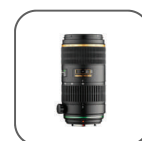
Obj. DA* 60-250mm