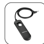
Câble de déclenchement