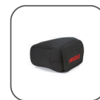
Étui en néoprène