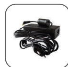
Kit adaptateur AC