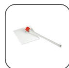
Kit de nettoyage